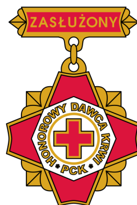
(dawniej III stopnia)