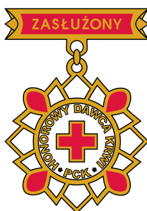
(dawniej II stopnia)