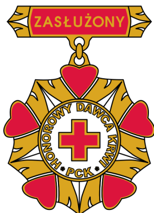
(dawniej I stopnia)